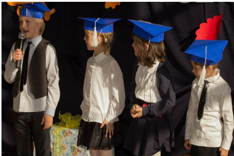
Składanie przysięgi na sztandar szkolny