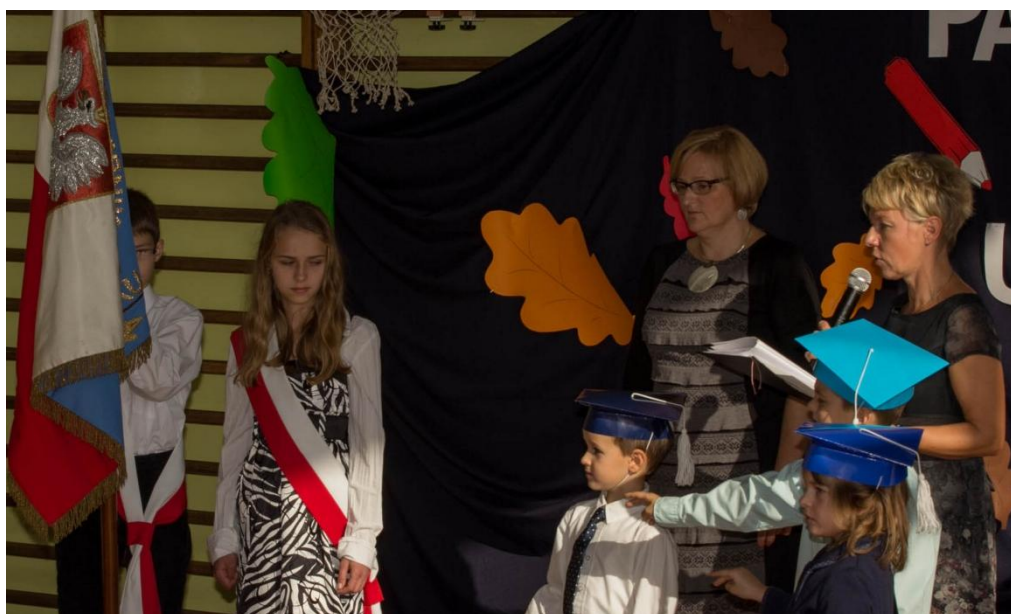
Szkoło, szkoło, jak się masz? Jesteśmy już uczniami!