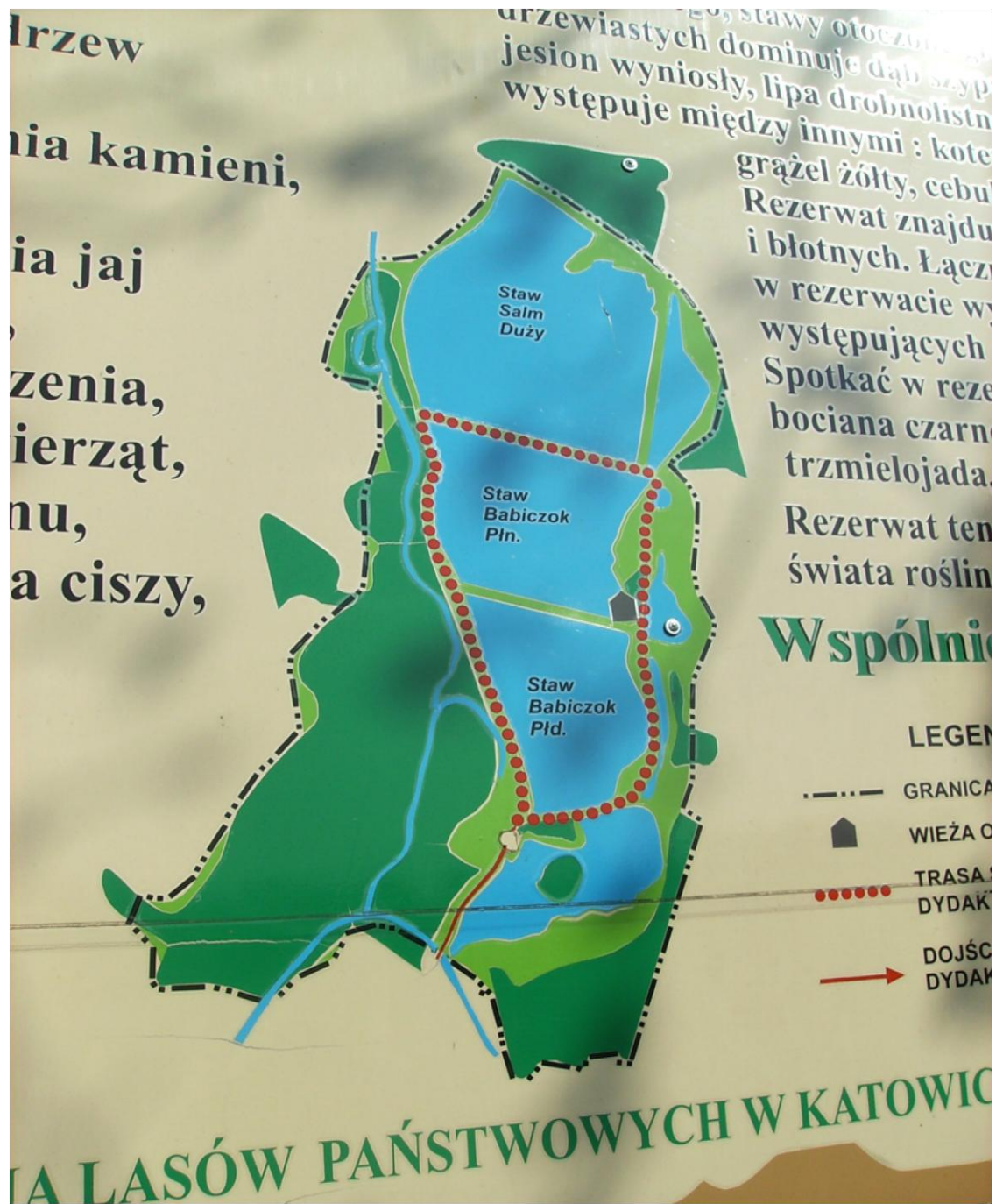
Plan parku „Łęczok”