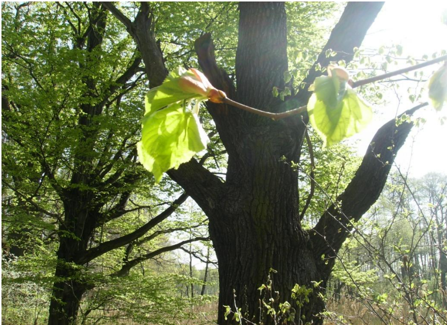
młode liście lipy